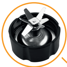
Ostrza ze stali nierdzewnej